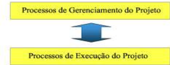
Fig. 2 - Diferença entre processos de gerenciamento e os processos de execução do projeto.

Um conceito que é importante compreender é a diferença entre processos de gerenciamento e os processos de execução do projeto. A Fig. 2 ilustra este conceito. Os processos de execução do projeto são aqueles que levam à geração dos produtos do projeto, ao passo que os processos de gerenciamento fazem com que os processos de execução sigam os parâmetros determinados pelo plano do projeto.