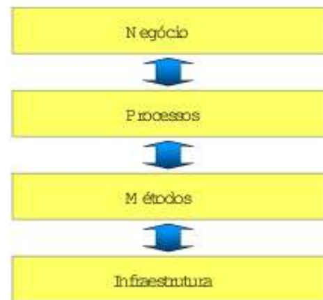
Fig 1 - Hierarquia de relacionamento entre o negócio da organização, os seus processos, os métodos e a infra-estrutura de suporte.

Uma boa metodologia de gerenciamento de projetos deve ser coerente com o negócio da organização [Kezner00]. Isto significa que o desenvolvimento de uma metodologia não deve ser feita sem o conhecimento do negócio da organização. Na Fig. 1 é apresentada a hierarquia de relacionamento entre o negócio da organização, os seus processos, os métodos e a infra-estrutura de suporte. A forma com que uma organização trabalha é determinada por seus processos. Cada processo, por sua vez, é executado utilizando-se um ou mais métodos de trabalho. Cada método pode ter o suporte de uma infra-estrutura (por exemplo, de Tecnologia da Informação). Isto significa que, para criar a metodologia é preciso conhecer os processos da organização relevantes ao gerenciamento de projetos.